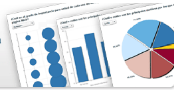
Diagrama de respuestas

Tu también puedes lanzar encuestas como esta Gestiona GRATIS tus propias encuestas online